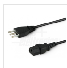
Cavo ingresso con spina Italia